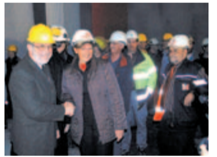
Handschlag zum Durchschlag OW-NW.