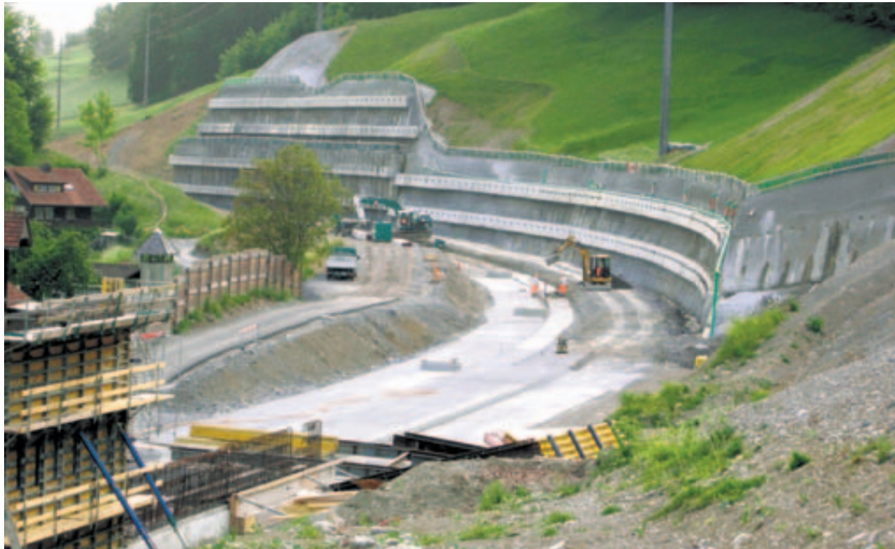
Tunnelbaugrube mit rückverankerter Bohrpfahlwand und Riegelwand.

Die Betonarbeiten konnten im Frühling 2008 gestartet werden. Für den 420 m langen Tunnel und die zugehörige Elektrozentrale sind rund 14 000 m 3 Beton nötig. Der Tunnel wird von Süden nach Norden gebaut. Es werden im Wochentakt Bodenplatte, Wände und Decke in 10 m langen Etappen geschalt, armiert und betoniert. Der Hochbaukran ist auf 2 Schienen installiert und wird jede Woche auch um diese 10 m verschoben. Ende November 2008 konnte die Decke des Blockes Nr. 26 betoniert werden, d. h. etwas mehr als die Hälfte des Tunnels ist gebaut.