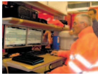
Testen der Steuerungen.