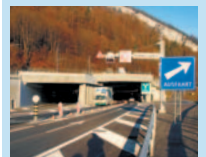
Portal z'Matt, Alpachstad.