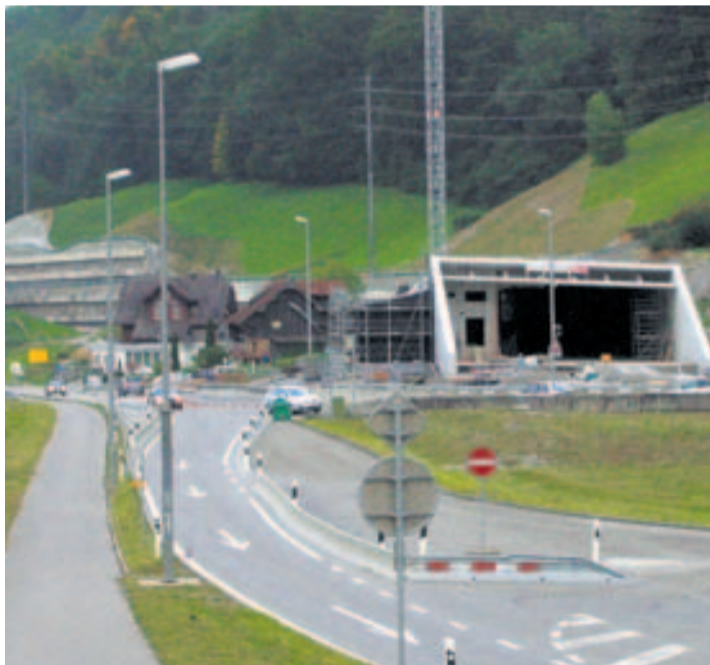
Südportal mit angebauter Elektrozentrale.

Bereits gebaut sind die neue Stützmauer entlang der Brünigstrasse und ein Grossteil der Verbauung des Rüttelgrabens mit dem Geschieberückhaltebecken. Gestartet sind die Arbeiten für die weiteren Stützmauern und Hangsicherungen im Bereich der offenen Linienführung der Nationalstrasse und die Verbauung der Bäche mit Geschiebesammler bergseits des Gasthofes Zollhaus. Die Betriebs- und Sicherheitsausrüstung des Tunnels Zollhaus sind projektiert und werden Anfang 2009 ausgeschrieben. Die Montagearbeiten im Tunnel erfolgen dann im Jahr 2010.