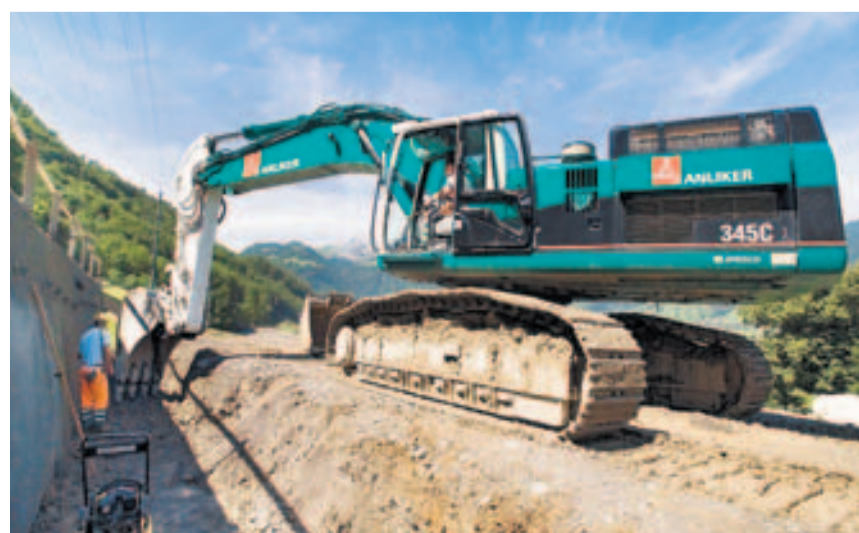
Aushub für Tagbautunnel Zollhaus.