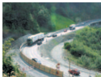
Lungern Süd Brünigstrasse.