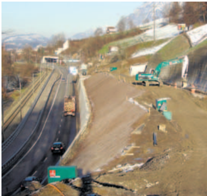
Trassearbeiten gegen Südportal Tunnel Sachseln.