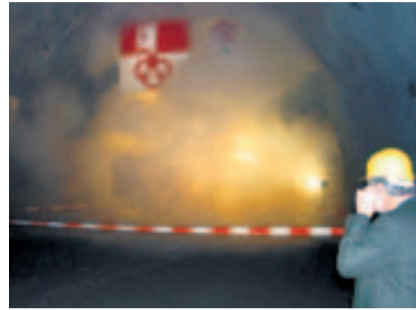
Durchschlag Verbindungstunnel 2005.