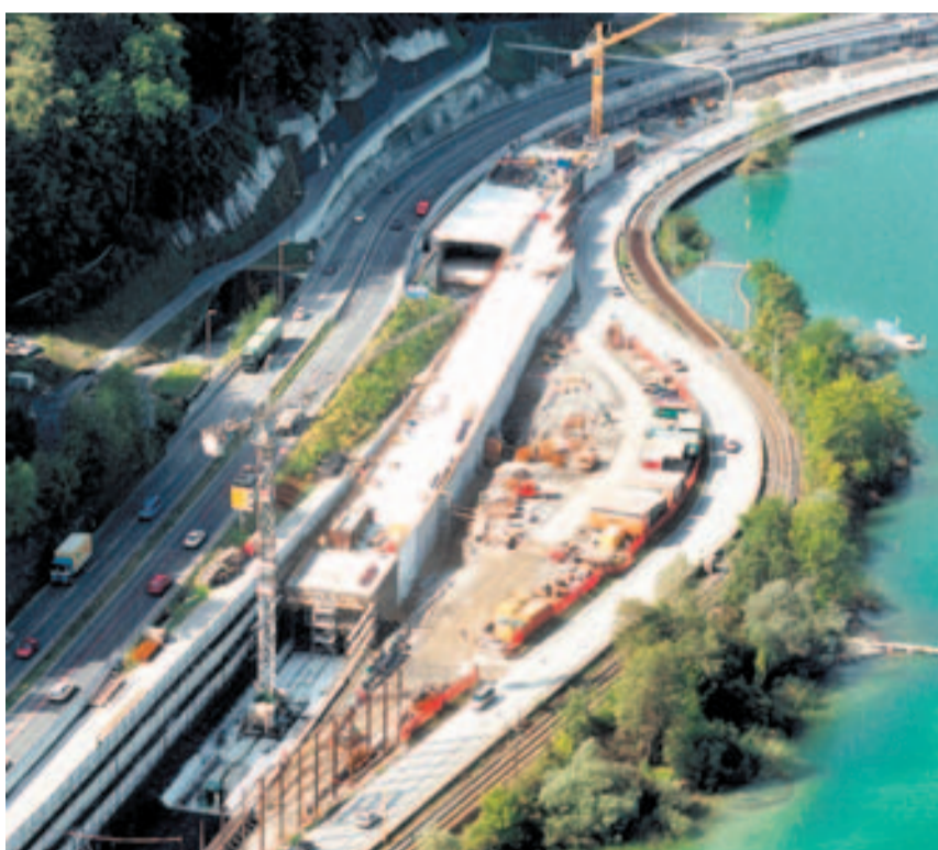
Bahntunnel Haltiwald Horw/Hergiswil.