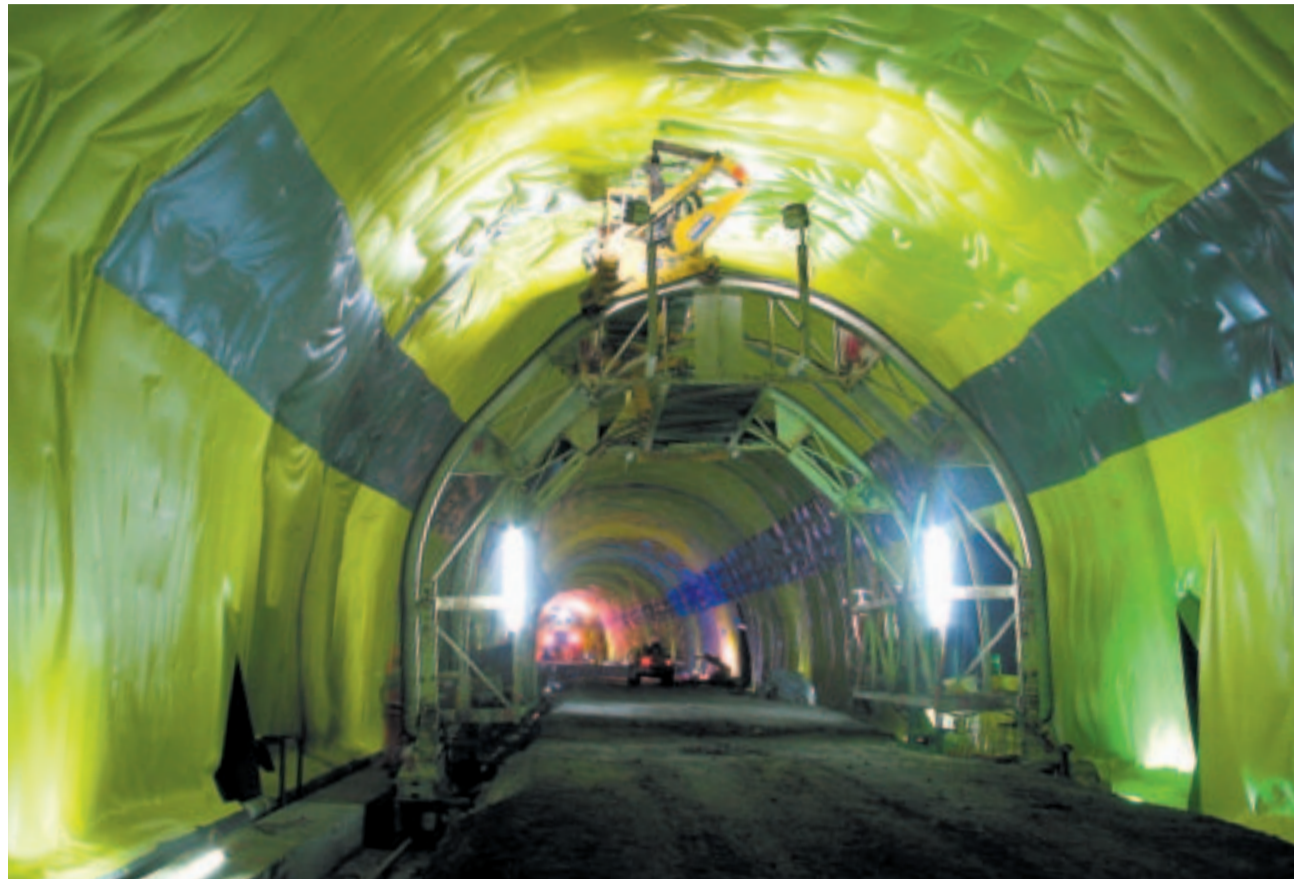
Gewölbeabdichtung mit Sika Sarnafil Folie im Tunnel Lungern.

Das herausgesprengte Felsmaterial wird im Tunnel durch einen Brecher zerkleinert. Es gelangt dann über ein Förderband, das im Sicherheitsstollen installiert ist, zum Südportal und von dort zur 400 m entfernten Deponie Hinti. Dort lagern bereits über 150 000 m 3 Tunnelausbruch. Dieses Transportkonzept hat sich bisher sehr gut bewährt.