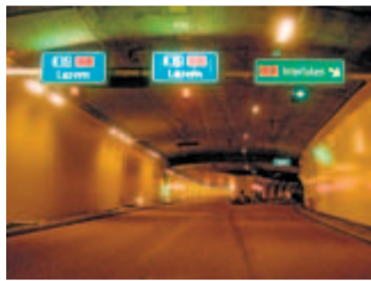
Abzweiger Richtung Obwalden.