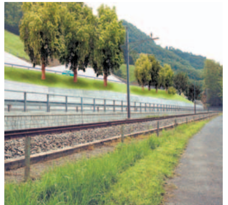
Fotomontage: National- und Brünigstrasse, Bahn und Seeweg.