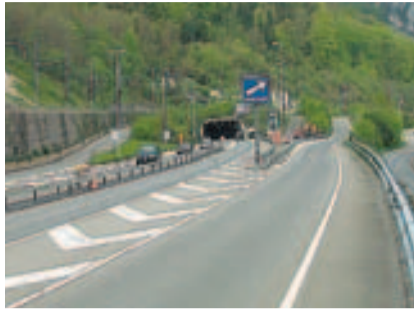
Portal z'Matt vor Baubeginn.