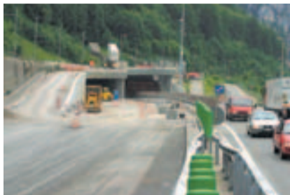
Portal z'Matt im Bau.