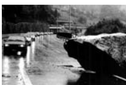
Felssturz vom 28. August 1986.

Der Hauptgrund für die Verlegung der offenen Lopperstrecke der A2 in den Berg liegt in der akuten Gefährdung durch Steinschlag- und Felssturzereignisse, wie der Felssturz vom 28. August 1986 belegt. Mit dem Verbindungstunnel A2/A8 können Stansstad und auch