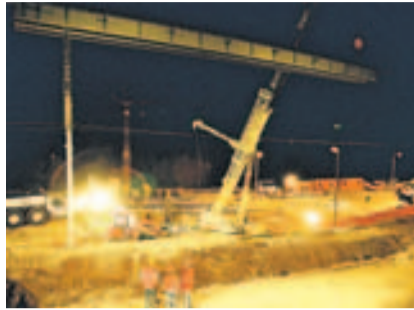
Bahnhilfsbrücke Portal z'Matt.