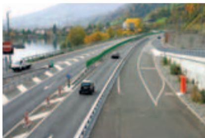
Portal z'Matt, Blick Richtung Süden.