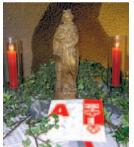
Statue heilige Barbara.