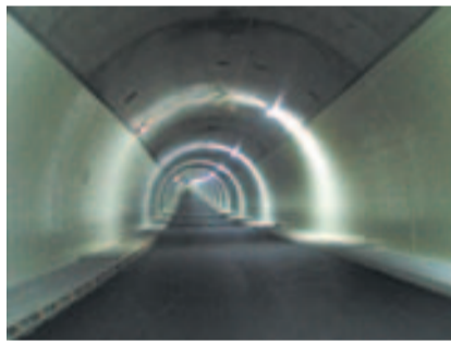
Verbindungstunnel im Rohbau.