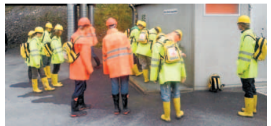
Kantonsschüler von Sarnen beim obligatorischen Stiefelwaschen.

Die Gruppen setzen sich vor allem aus Baufachleuten und aus Schülern, Lehrlingen und Studenten von technischen Berufen aus der ganzen Schweiz zusammen. Interessierte Gruppen können sich beim Hoch- und Tiefbauamt des Kantons melden.